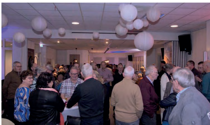
Overzichtsfoto tijdens het jubileumfeest.